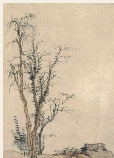
PAGE 5 弘仁 山水图册之二