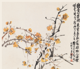
PAGE 10 陈半丁 花卉册·腊梅