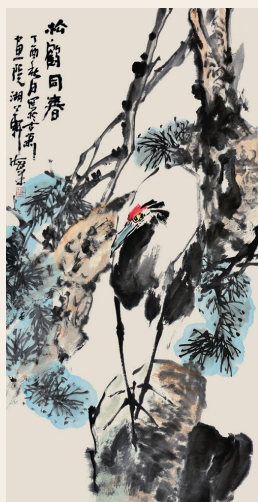
PAGE 32 陈海峰 松鹤同春