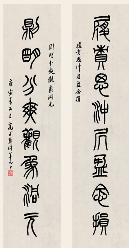
PAGE 32 高式熊 履責則明八言联