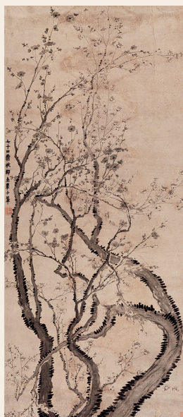
PAGE 11 清 金农 双色梅花图