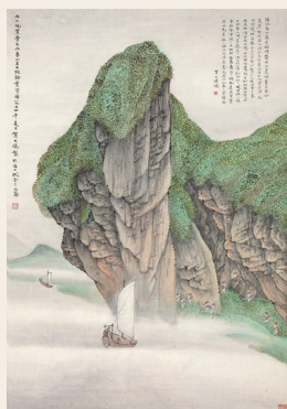
PAGE 13 贺天健 镇江象山