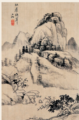
PAGE 16 陈师曾 花卉山水人物册页