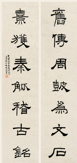
PAGE 32 赵叔孺 旧传熹获七言联