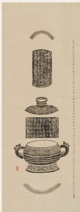
PAGE 17 图7 民国拓张勋老藏秦敦拓片