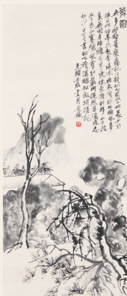
PAGE 14 吴昌硕 荒园图