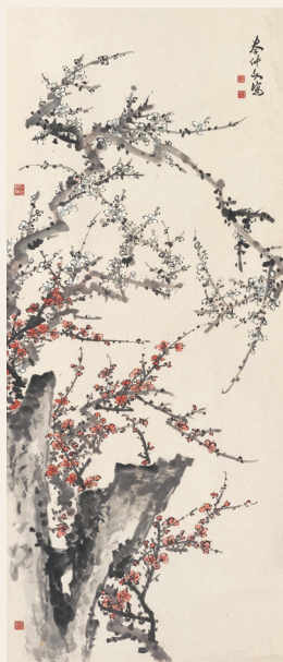
PAGE 19 秦仲文 梅花