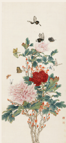
PAGE 14 陈之佛 牡丹群蝶