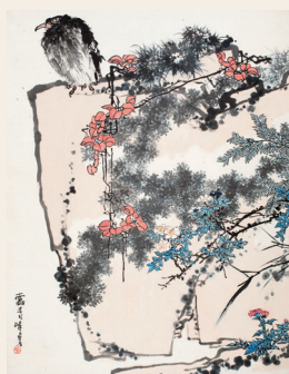
PAGE 29 潘天寿 鹰石山花图