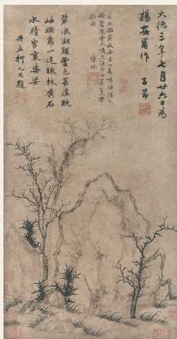
PAGE 28 元 赵孟頫 疏林秀石图