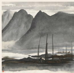
PAGE 19 林风眠 风景