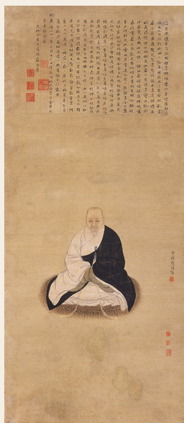
PAGE 11 明 钱复 真可和尚像