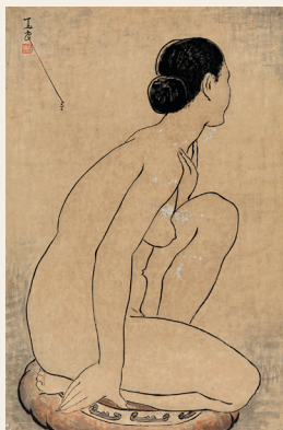
PAGE 13 潘玉良 跪着的女人