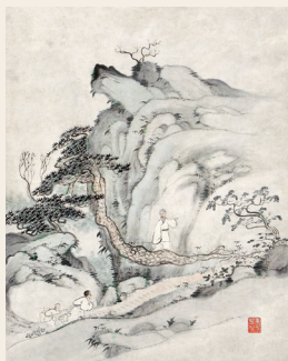
PAGE 6 石涛 黄山人物图册之六