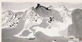
PAGE 17 吴冠中 春雪