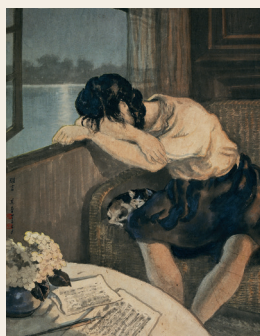
PAGE 15 宗其香 难言