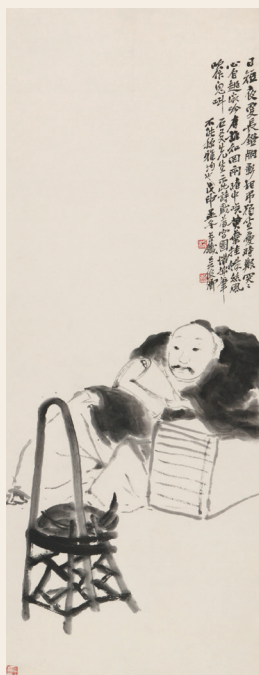
PAGE 15 吴昌硕 灯下观书