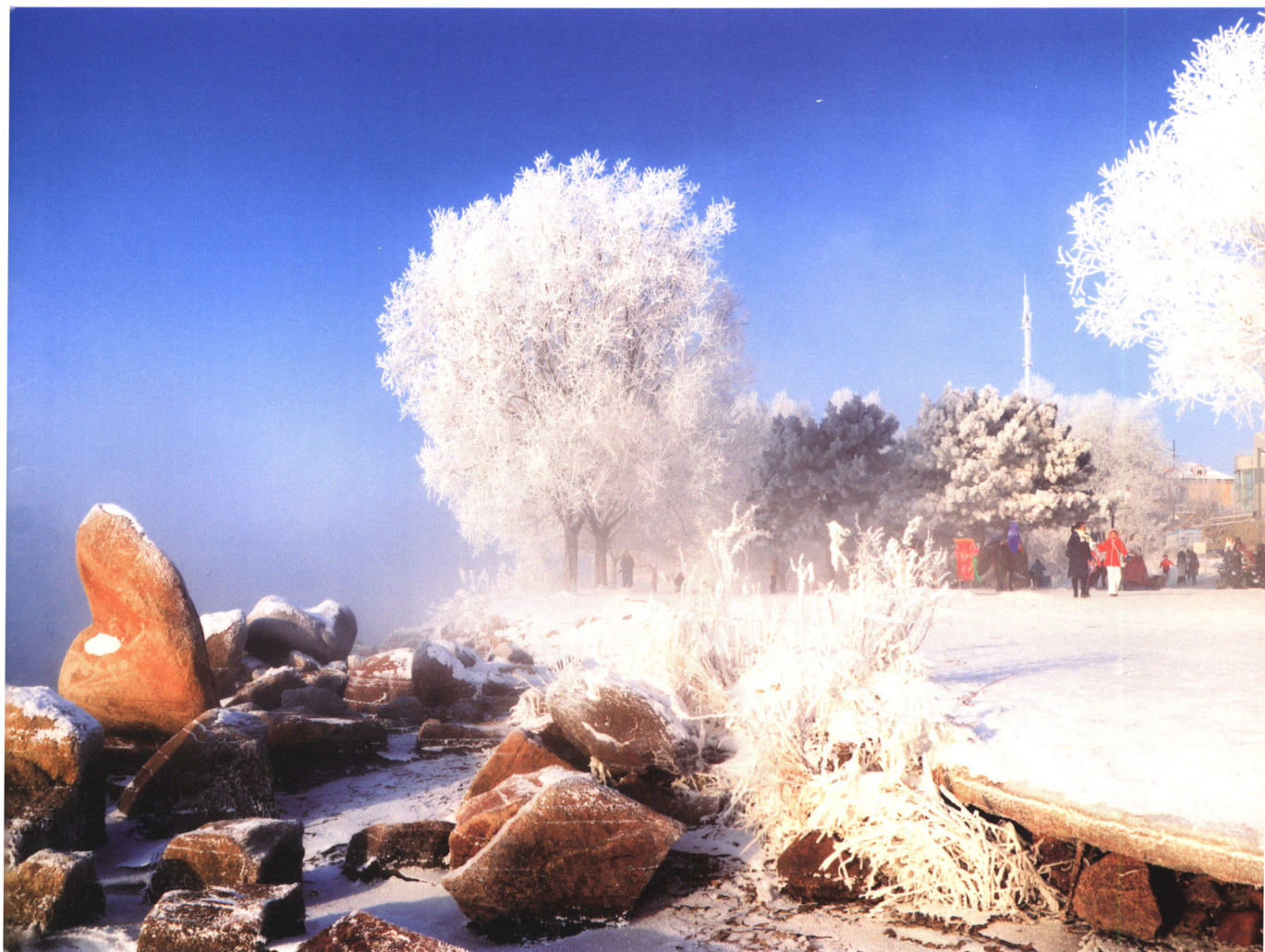
吉林雾凇