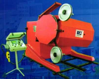
TSY-G 系列绳锯机 110kw