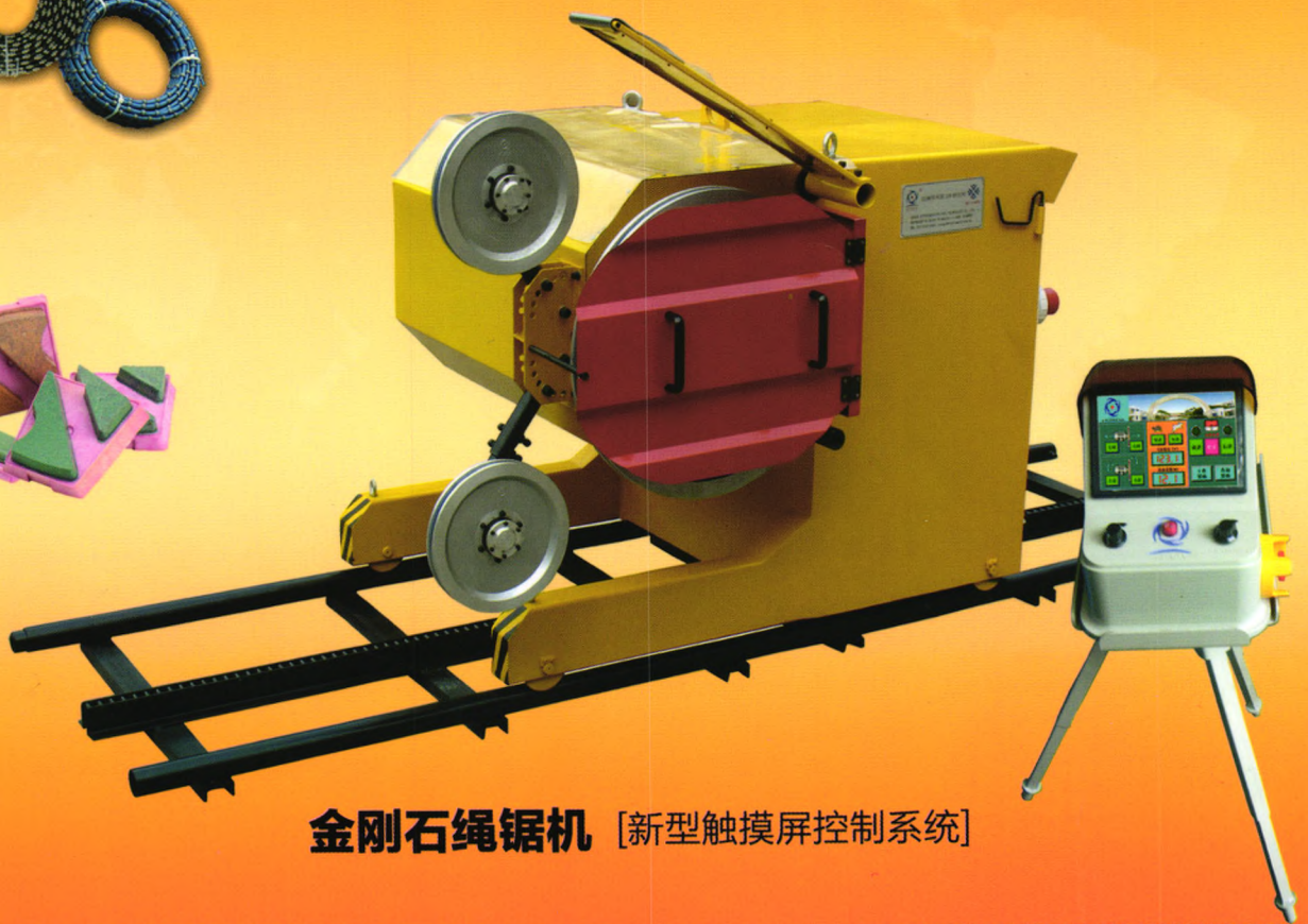
金刚石绳锯机 [新型触摸屏控制系统]

意大利技术生产 树脂结合剂金刚石 抛光工具, 寿命 长、抛速快, 抛光石英石可达 60~70度, 寿 命大幅度提高。