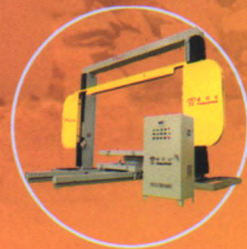
花岗岩大板切割组合绳锯机