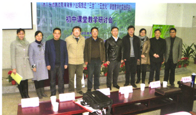
初中校本课程建设

在课程改革再出发的进程中,南京市玄武区以江苏省教育科学规划课题《区域推进提升中小学课程领导力的实践研究》为依托,在“十二五”初期,重点加强学校课程的顶层设计,广泛开展了学校课程规划的研究,每一所学校基于自身的文化积淀,形成了适应新课改精神、体现学校办学思想和特色、满足学生个性发展需求的学校课程规划。近年来,全区着力于课程规划从理想课程向现实课程的转化,引领各学校、各学科围绕各学校承担的教育教学课题的研究,通过专家指导、典型引路、协同研究、活动推进等方式,在完善学校课程规划、开发学校课程资源、进行学科课程与教学改革、丰富特色校本课程、完善课程实施保障机制等方面进行了实践研究,积极探索课程视野下教与学的方式的转型,提升学校课程的实施品质。