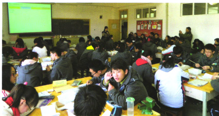
高中校本课程建设