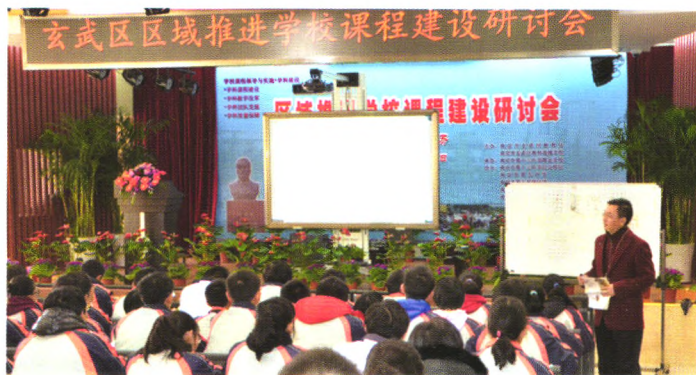
有效实施学科课程