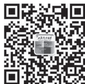
《上海预防医学》微信公众号