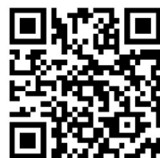
上海市预防医学会官网