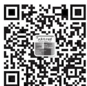
《上海预防医学》微信公众号