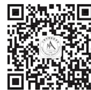
上海市预防医学会微信公众号