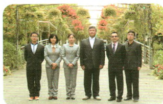
数学竞赛辅导小组