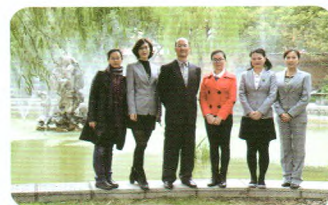
闵行区希望之星获得者