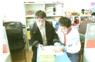
数学组教师指导学生