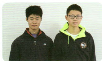
上海市数学竞赛一等奖获得者