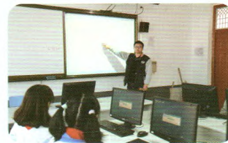
数学拓展课教学展示