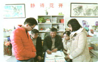
数学组教师集体备课