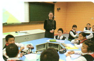
获奖数学教师教学展示