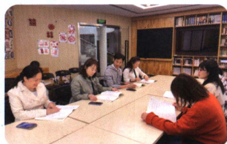
数学组开展“双新” 主题教研活动