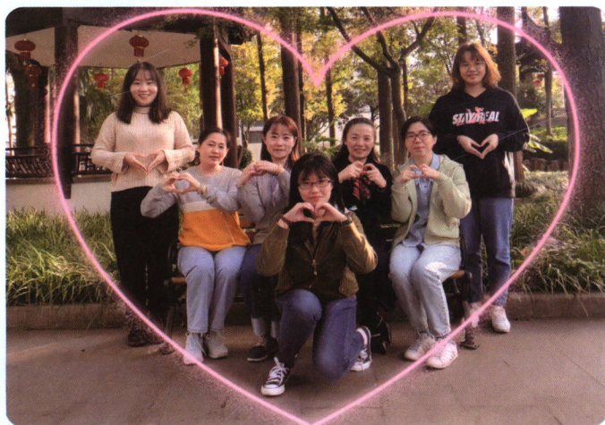
数学备课组教师合影