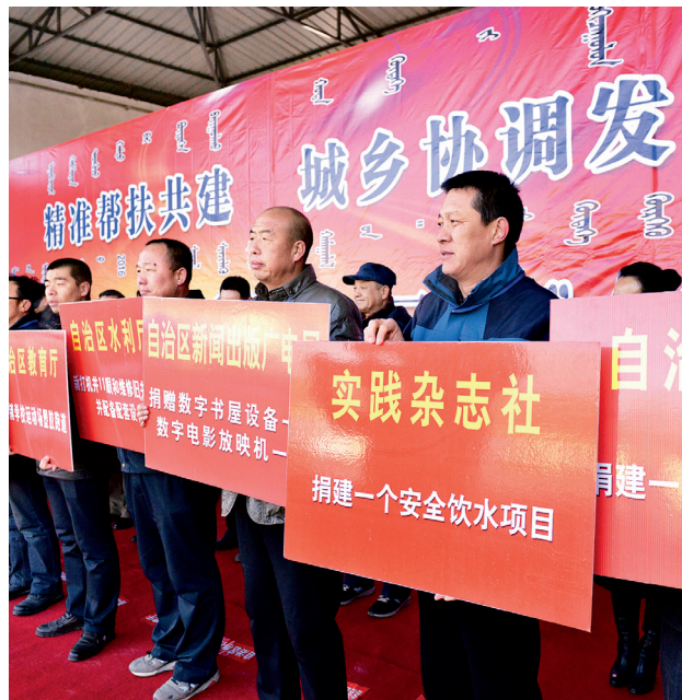
P28 本刊特稿 精准帮扶共建 城乡协调发展