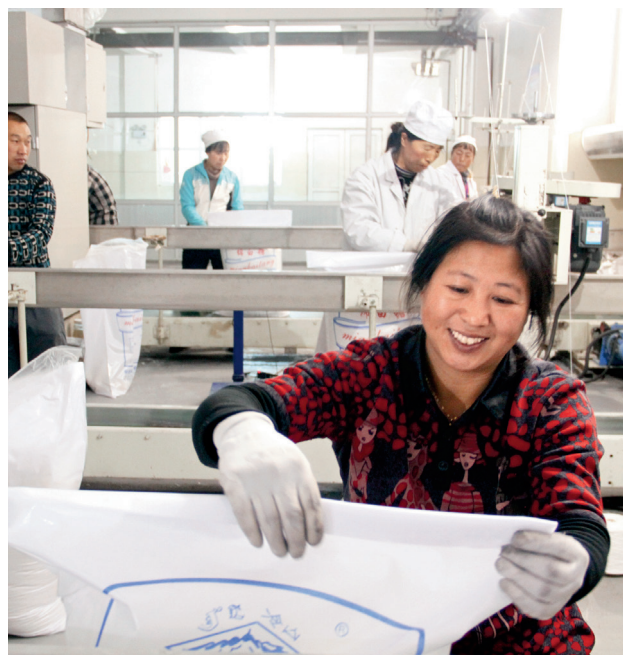
P49 亮丽风景线 立足资源禀赋 做好特色文章