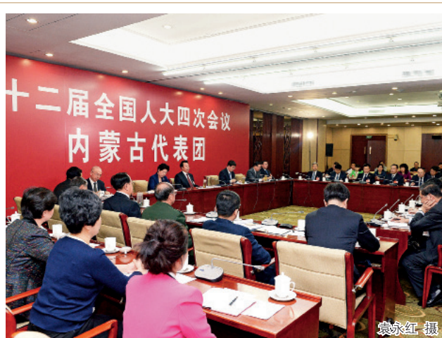
3月3日下午，出席十二届全国人大四次会议的内蒙古代表团举行全团会议。