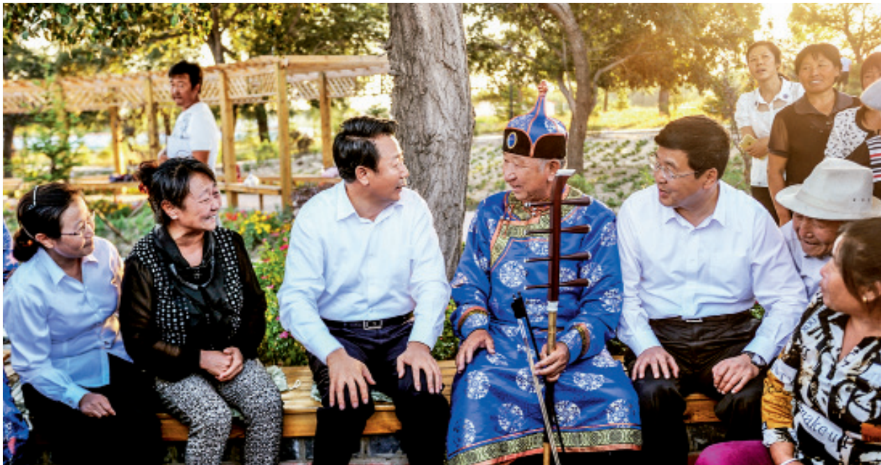
说说村里的新变化