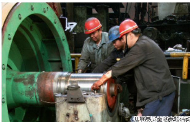
开展党员奉献专题活动