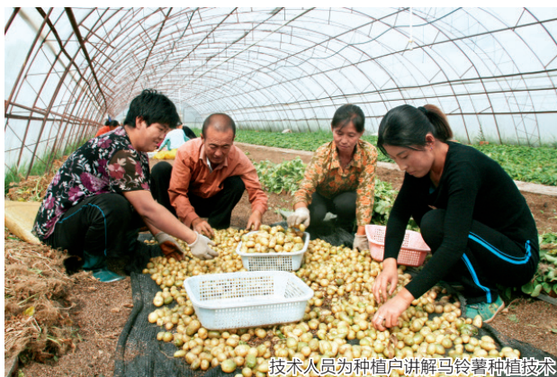
技术人员为种植户讲解马铃薯种植技术