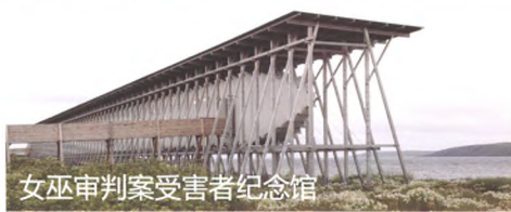
女巫审判案受害者纪念馆