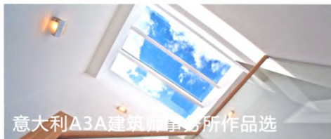
意大利A3A建筑事务所作品选