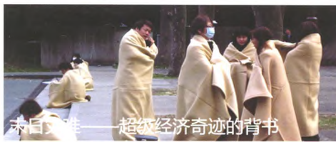
末日灾难——超级经济奇迹的背书