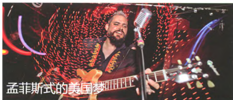
孟菲斯式的美国梦