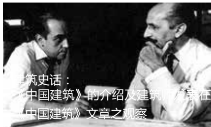
建筑史话： 《中国建筑》的介绍及建筑师发表在 《中国建筑》文章之观察