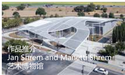
作品推介： Jan Shrem and Manetti Shrem 艺术博物馆