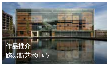
作品推介： 路易斯艺术中心