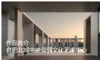
作品推介： 合肥北城中央公园文化艺术中心