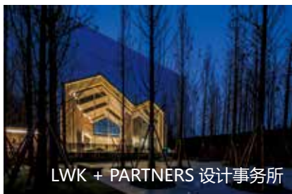
LWK + PARTNERS 设计事务所