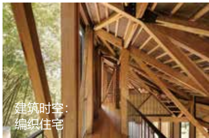
建筑时空： 编织住宅