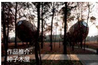
作品推介： 种子木屋