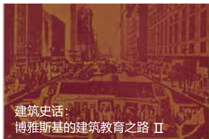
建筑史话： 博雅斯基的建筑教育之路 II