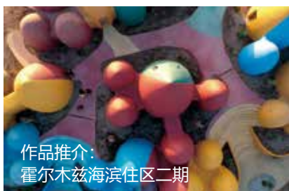
作品推介： 霍尔木兹海滨住区二期