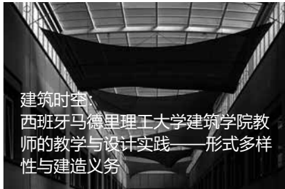
建筑时空： 西班牙马德里理工大学建筑学院教师的 教学与设计实践——形式多样性与建造义务