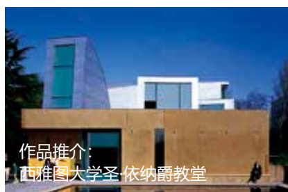
作品推介： 西雅图大学圣·依纳爵教堂