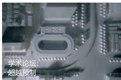
学术论坛： 超越预制