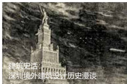
建筑史话： 深圳境外建筑设计历史漫谈