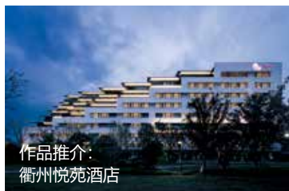
作品推介： 衢州悦苑酒店