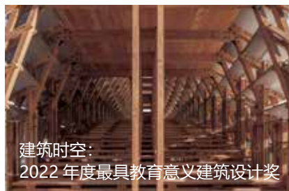
建筑时空： 2022 年度最具教育意义建筑设计奖