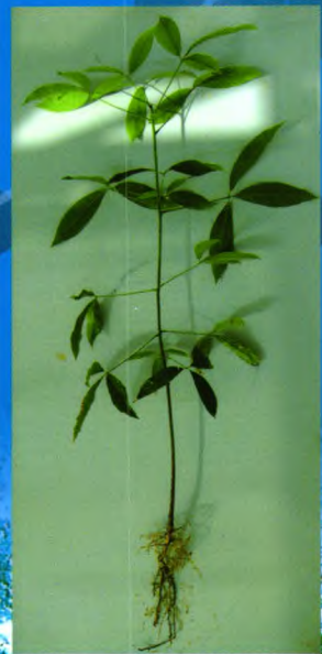
自根幼态无性系种苗