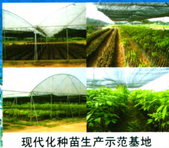
现代化种苗生产示范基地

我所良种苗木繁育基地建于2000年，总面积1000余亩，是集科研、示范、培训与推广于一体的现代化生产示范基地，基地主要生产热研7-33-97、热研7-20-59等品种的袋装苗、籽苗芽接苗、自根幼态无性系苗，年生产苗木100万株以上。其中橡胶树籽苗芽接苗(年生产能力20万株以上)、橡胶树自根幼态无性系种苗(年生产能力10万株以上)等新型种植材料的生产已成为种苗繁育的一个新亮点，较传统种植材料有生长快、高产、抗风性强等特点。基地以质量为本，对购苗者提供全方位技术指导和售后服务。