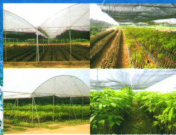
现代化种苗生产示范基地