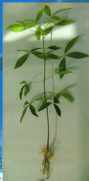
自根幼态无性系种苗

我所良种苗木繁育基地建于2000年，总面积1000余亩，是集科研、示范、培训与推广于一体的现代化生产示范基地，基地主要生产热研7-33-97、热研7-20-59等品种的袋装苗、籽苗芽接苗、自根幼态无性系苗，年生产苗木100万株以上。其中橡胶树籽苗芽接苗(年生产能力20万株以上)、橡胶树自根幼态无性系种苗(年生产能力10万株以上)等新型种植材料的生产已成为种苗繁育的一个新亮点，较传统种植材料有生长快、高产、抗风性强等特点。基地以质量为本，对购苗者提供全方位技术指导 and 售后服务。