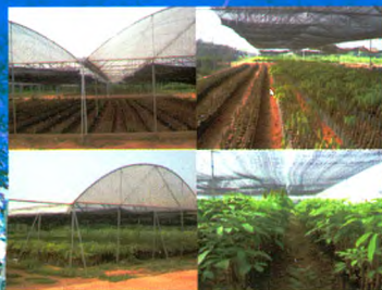
现代化种苗生产示范基地

我所良种苗木繁育基地建于2000年，总面积1000余亩，是集科研、示范、培训与推广于一体的现代化生产示范基地，基地主要生产热研7-33-97、热研7-20-59等品种的袋装苗、籽苗芽接苗、自根幼态无性系苗，年生产苗木100万株以上。其中橡胶树籽苗芽接苗(年生产能力20万株以上)、橡胶树自根幼态无性系种苗(年生产能力10万株以上)等新型种植材料的生产已成为种苗繁育的一个新亮点，较传统种植材料有生长快、高产、抗风性强等特点。基地以质量为本，对购苗者提供全方位技术指导和售后服务。