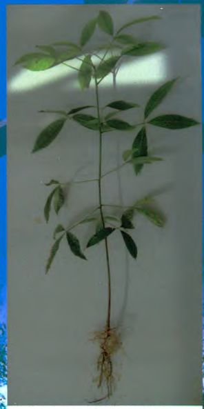
自根幼态无性系种苗