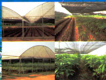
现代化种苗生产示范基地