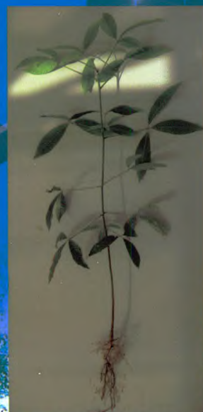
自根幼态无性系种苗

我所良种苗木繁育基地建于2000年，总面积1000余亩，是集科研、示范、培训与推广于一体的现代化生产示范基地，基地主要生产热研7-33-97、热研7-20-59等品种的袋装苗、籽苗芽接苗、自根幼态无性系苗，年生产苗木100万株以上。其中橡胶树籽苗芽接苗(年生产能力20万株以上)、橡胶树自根幼态无性系种苗(年生产能力10万株以上)等新型种植材料的生产已成为种苗繁育的一个新亮点，较传统种植材料有生长快、高产、抗性强等特点。基地以质量为本，对购苗者提供全方位技术指导 and 售后服务。