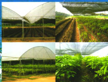
现代化种苗生产示范基地