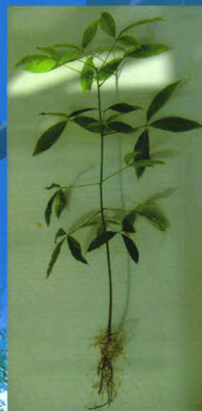
自根幼态无性系种苗

我所良种苗木繁育基地建于2000年，总面积1000余亩，是集科研、示范、培训与推广于一体的现代化生产示范基地，基地主要生产热研7-33-97、热研7-20-59等品种的袋装苗、籽苗芽接苗、自根幼态无性系苗，年生产苗木100万株以上。其中橡胶树籽苗芽接苗(年生产能力20万株以上)、橡胶树自根幼态无性系种苗(年生产能力10万株以上)等新型种植材料的生产已成为种苗繁育的一个新亮点，较传统种植材料有生长快、高产、抗风性强等特点。基地以质量为本，对购苗者提供全方位技术指导和售后服务。