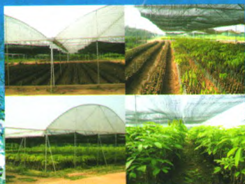
现代化种苗生产示范基地

我所良种苗木繁育基地建于2000年，总面积1000余亩，是集科研、示范、培训与推广于一体的现代化生产示范基地，基地主要生产热研7-33-97、热研7-20-59等品种的袋装苗、籽苗芽接苗、自根幼态无性系苗，年生产苗木100万株以上。其中橡胶树籽苗芽接苗(年生产能力20万株以上)、橡胶树自根幼态无性系种苗(年生产能力10万株以上)等新型种植材料的生产已成为种苗繁育的一个新亮点，较传统种植材料有生长快、高产、抗风性强等特点。基地以质量为本，对购苗者提供全方位技术指导 and 售后服务。