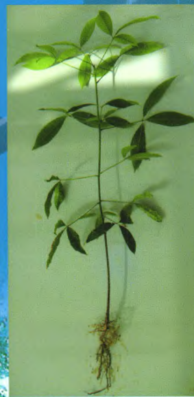
自根幼态无性系种苗