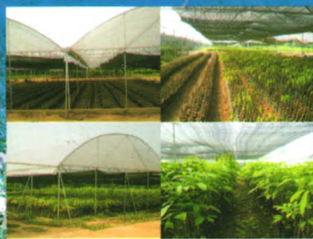
现代化种苗生产示范基地

我所良种苗木繁育基地建于2000年，总面积1000余亩，是集科研、示范、培训与推广于一体的现代化生产示范基地，基地主要生产热研7-33-97、热研7-20-59等品种的袋装苗、籽苗芽接苗、自根幼态无性系苗，年生产苗木100万株以上。其中橡胶树籽苗芽接苗(年生产能力20万株以上)、橡胶树自根幼态无性系种苗(年生产能力10万株以上)等新型种植材料的生产已成为种苗繁育的一个新亮点，较传统种植材料有生长快、高产、抗风性强等特点。基地以质量为本，对购苗者提供全方位技术指导 and 售后服务。