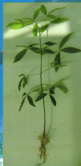
自根幼态无性系种苗