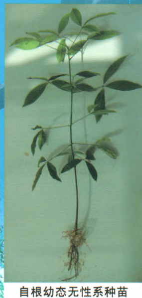
自根幼态无性系种苗

我所良种苗木繁育基地建于2000年，总面积1000余亩，是集科研、示范、培训与推广于一体的现代化生产示范基地，基地主要生产热研7-33-97、热研7-20-59等品种的袋装苗、籽苗芽接苗、自根幼态无性系苗，年生产苗木100万株以上。其中橡胶树籽苗芽接苗(年生产能力20万株以上)、橡胶树自根幼态无性系种苗(年生产能力10万株以上)等新型种植材料的生产已成为种苗繁育的一个新亮点，较传统种植材料有生长快、高产、抗风性强等特点。基地以质量为本，对购苗者提供全方位技术指导 and 售后服务。