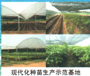
现代化种苗生产示范基地