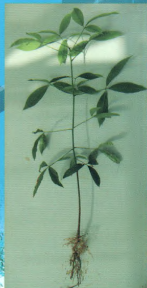
自根幼态无性系种苗