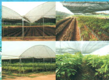
现代化种苗生产示范基地

我所良种苗木繁育基地建于2000年，总面积1000余亩，是集科研、示范、培训与推广于一体的现代化生产示范基地，基地主要生产热研7-33-97、热研7-20-59等品种的袋装苗、籽苗芽接苗、自根幼态无性系苗，年生产苗木100万株以上。其中橡胶树籽苗芽接苗(年生产能力20万株以上)、橡胶树自根幼态无性系种苗(年生产能力10万株以上)等新型种植材料的生产已成为种苗繁育的一个新亮点，较传统种植材料有生长快、高产、抗风性强等特点。基地以质量为本，对购苗者提供全方位技术指导 and 售后服务。