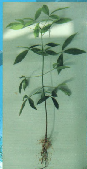
自根幼态无性系种苗