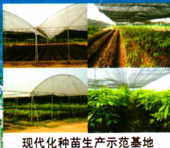
现代化种苗生产示范基地

我所良种苗木繁育基地建于2000年，总面积1000余亩，是集科研、示范、培训与推广于一体的现代化生产示范基地，基地主要生产热研7-33-97、热研7-20-59等品种的袋装苗、籽苗芽接苗、自根幼态无性系苗，年生产苗木100万株以上。其中橡胶树籽苗芽接苗(年生产能力20万株以上)、橡胶树自根幼态无性系种苗(年生产能力10万株以上)等新型种植材料的生产已成为种苗繁育的一个新亮点，较传统种植材料有生长快、高产、抗风性强等特点。基地以质量为本，对购苗者提供全方位技术指导 and 售后服务。