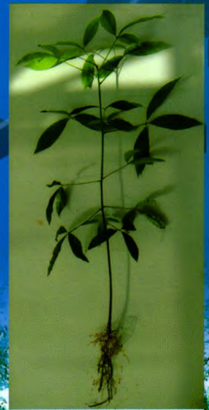
自根幼态无性系种苗

我所良种苗木繁育基地建于2000年，总面积1000余亩，是集科研、示范、培训与推广于一体的现代化生产示范基地，基地主要生产热研7-33-97、热研7-20-59等品种的袋装苗、籽苗芽接苗、自根幼态无性系苗，年生产苗木100万株以上。其中橡胶树籽苗芽接苗(年生产能力20万株以上)、橡胶树自根幼态无性系种苗(年生产能力10万株以上)等新型种植材料的生产已成为种苗繁育的一个新亮点，较传统种植材料有生长快、高产、抗风性强等特点。基地以质量为本，对购苗者提供全方位技术指导 and 售后服务。