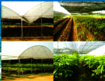
现代化种苗生产示范基地