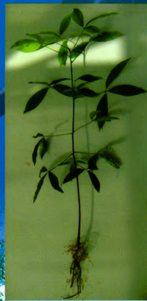
自根幼态无性系种苗