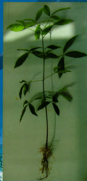
自根幼态无性系种苗