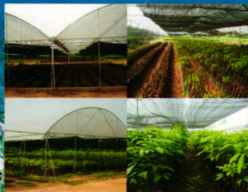
现代化种苗生产示范基地

我所良种苗木繁育基地建于2000年，总面积1000余亩，是集科研、示范、培训与推广于一体的现代化生产示范基地，基地主要生产热研7-33-97、热研7-20-59等品种的袋装苗、籽苗芽接苗、自根幼态无性系苗，年生产苗木100万株以上。其中橡胶树籽苗芽接苗(年生产能力20万株以上)、橡胶树自根幼态无性系种苗(年生产能力10万株以上)等新型种植材料的生产已成为种苗繁育的一个新亮点，较传统种植材料有生长快、高产、抗风性强等特点。基地以质量为本，对购苗者提供全方位技术指导和售后服务。