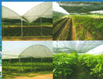
现代化种苗生产示范基地