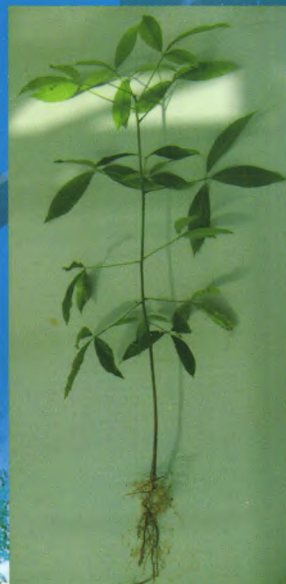
自根幼态无性系种苗

我所良种苗木繁育基地建于2000年，总面积1000余亩，是集科研、示范、培训与推广于一体的现代化生产示范基地，基地主要生产热研7-33-97、热研7-20-59等品种的袋装苗、籽苗芽接苗、自根幼态无性系苗，年生产苗木100万株以上。其中橡胶树籽苗芽接苗(年生产能力20万株以上)、橡胶树自根幼态无性系种苗(年生产能力10万株以上)等新型种植材料的生产已成为种苗繁育的一个新亮点，较传统种植材料有生长快、高产、抗风性强等特点。基地以质量为本，对购苗者提供全方位技术指导 and 售后服务。