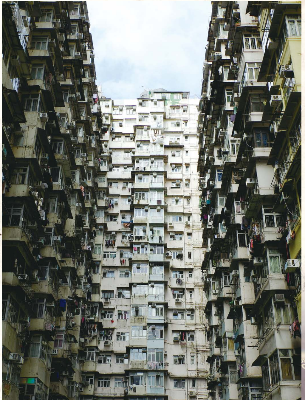
摄于中国香港山海楼南侧

【作者】任红伏，中国摄影家协会会员。无他好，唯以摄影为乐，倏忽三十余载，已逾天命，尚有余梦，师造化，与路同道。