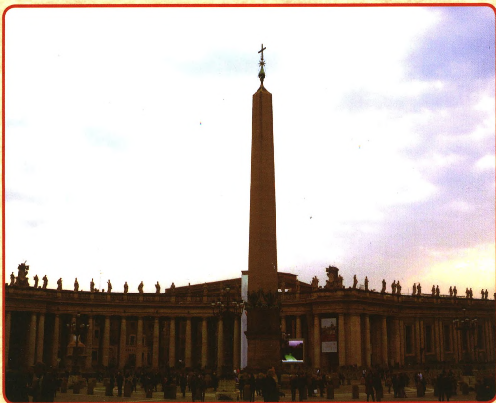
梵蒂冈圣彼得广场中心方尖碑