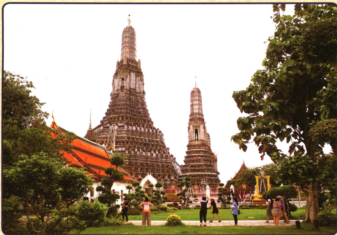
泰国曼谷黎明寺 西庵 供稿