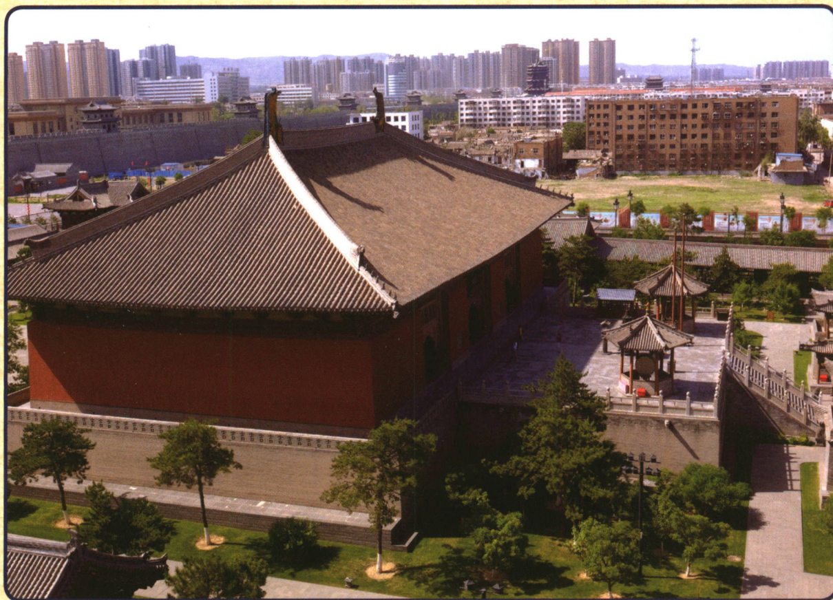
山西大同华严寺薄伽教藏殿